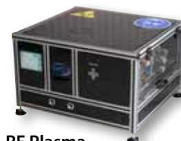
RF Plasma Multifunction Reactor